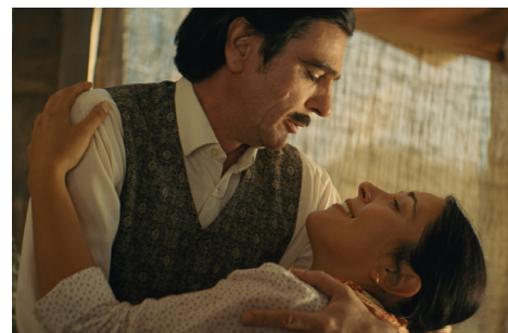
▶ Sanghaj / Shanghai Gypsy