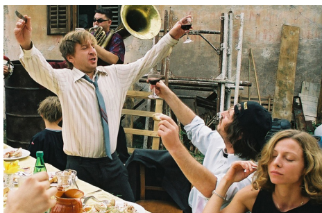
▶ Odgrobadogroba / Gravehopping