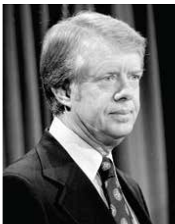
James Earl 'Jimmy' Carter