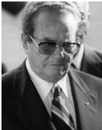
Josip Broz Tito