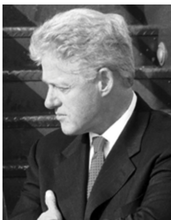
William Jefferson Clinton