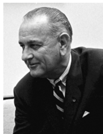
Lyndon B. Johnson