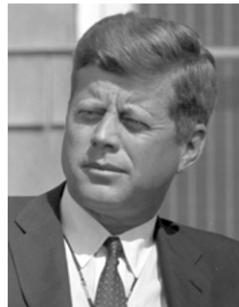
John F. Kennedy